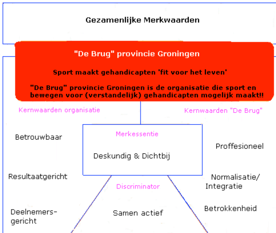
Afb. 3.1: gezamenlijke merkwaarden

De komende vier jaar zullen de volgende gezamenlijke merkwaarden kenmerkend zijn voor "De Brug" provincie Groningen.